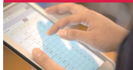
タブレットで場所を選ばず簡単に入力が可能に