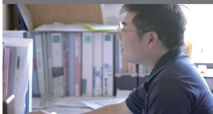
従来はスタッフルームにあるパソコンで入力していました