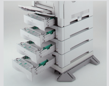
※写真はオプションを装着した状態です。