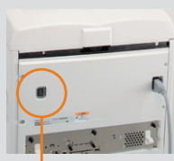
除湿ヒーターのスイッチ

吸湿が原因で発生するトラブルを未然に防ぐために、除湿ヒーターを各トレイに標準搭載しています。