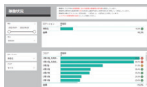
●稼働状況(ロケーション・フロア別)

※各分析画面は、Microsoft Power BIテンプレートの利用例となります。