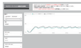
●パーティション稼働状況(日単位推移)